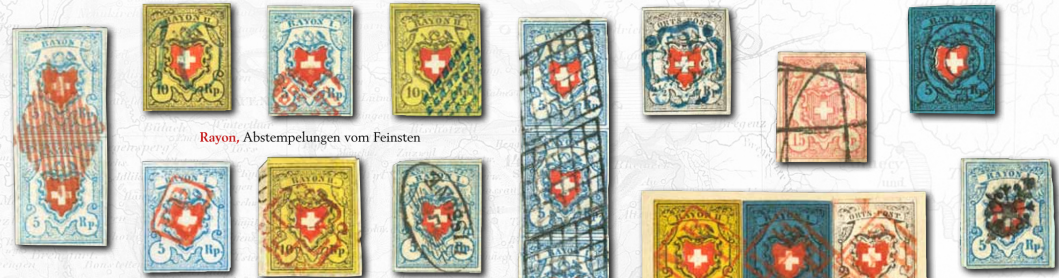
Rayon, Abstemplungen vom Feinsten