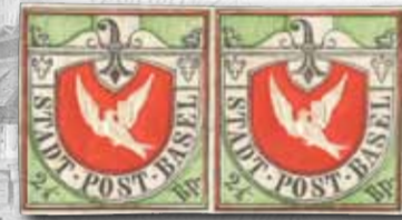
Basel, Basler Taube Probedruck, unverausgabtes im waagerechten Paar