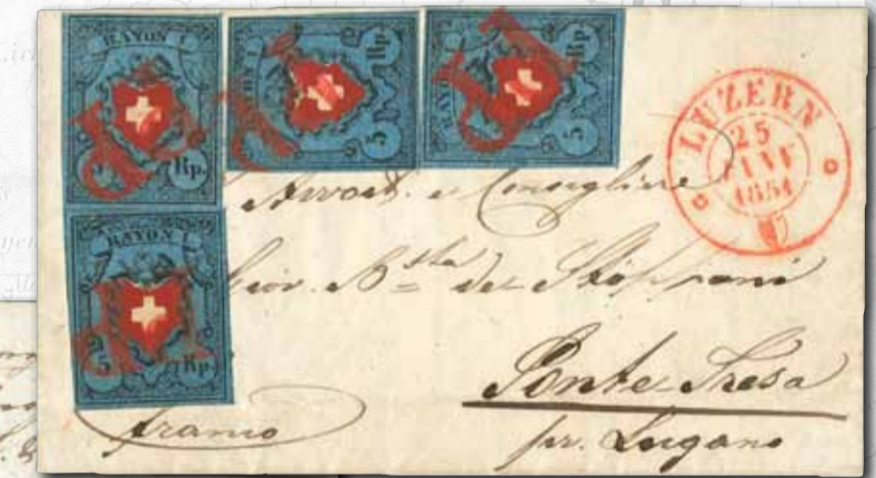
Rayon, schöne Mehrfachfrankatur auf Brief von Luzern nach Ponte Tresa via Lugano