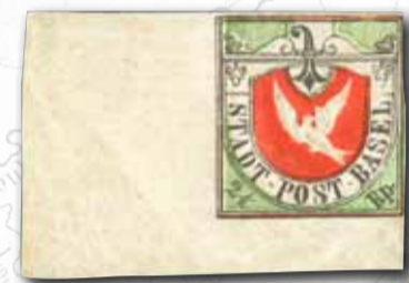
Basel, ca. 1845