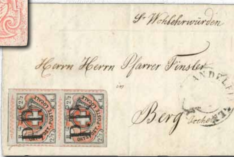
Zürich, Winterthur im senkrechten Paar auf Brief von Andelfingen nach Berg a. Irchel