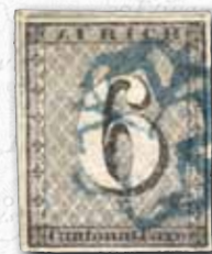
Zürich, Zürich 6 mit seltener blauen Zürcher Rosette