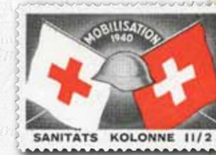
Soldatenmarken, aus dem 3. Teil der grossartigen Kollektion Soldatenmarken