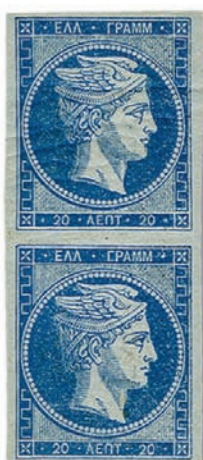
Lot 448: Greece 1861/62, First Athens printing 20 lepta unused vertical pair. CHF 18,150.- (incl. buyer's premium)