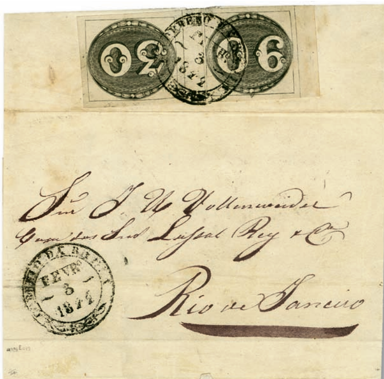
Lot 1503: Brazil 1843, Bull's Eyes 30 + 90 reis on cover CHF 21,780.- (incl. buyer's premium)