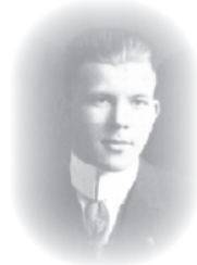
Josiah K. Lilly Jr.