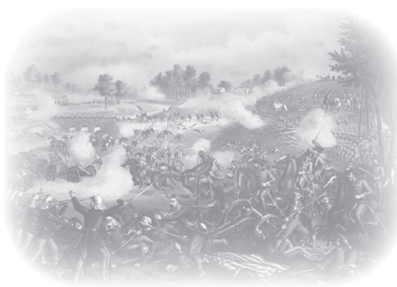
The Battle of Bull Run