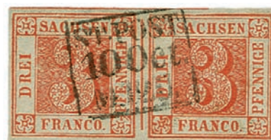
Los 608: Sachsen 1850, ‚Sachsen Dreier‘ im Paar mit Stempel des Stadtpostamtes. CHF 37.510,- (inkl. Aufgeld)