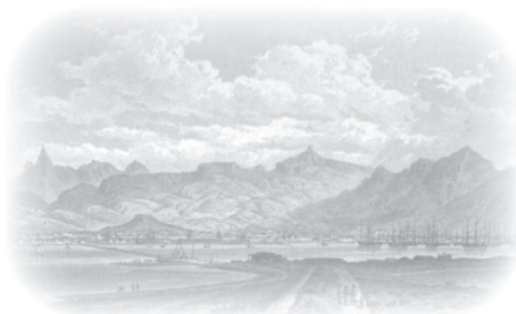
View of Port Louis