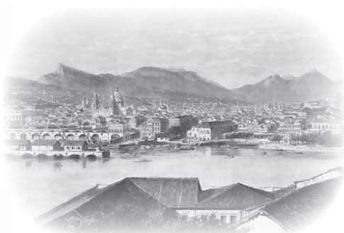
View of Rio de Janeiro in 1852