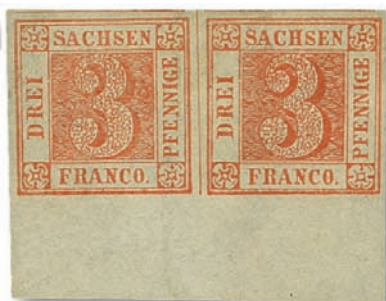
Los 604: Sachsen 1850, ‚Sachsen Dreier‘ im ungebrauchten Unterrand-Paar. Ex Kollektion König Carol II von Rumänien CHF 38.720,- (inkl. Aufgeld)