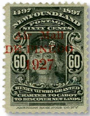
Lot 1967: Newfoundland Air Mail / DE PINEDO / 1927, 60 cents, unused. CHF 32,670.- (incl. buyer's premium)