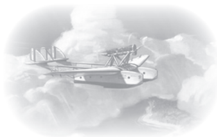
Savoia S-55 Flying Boat