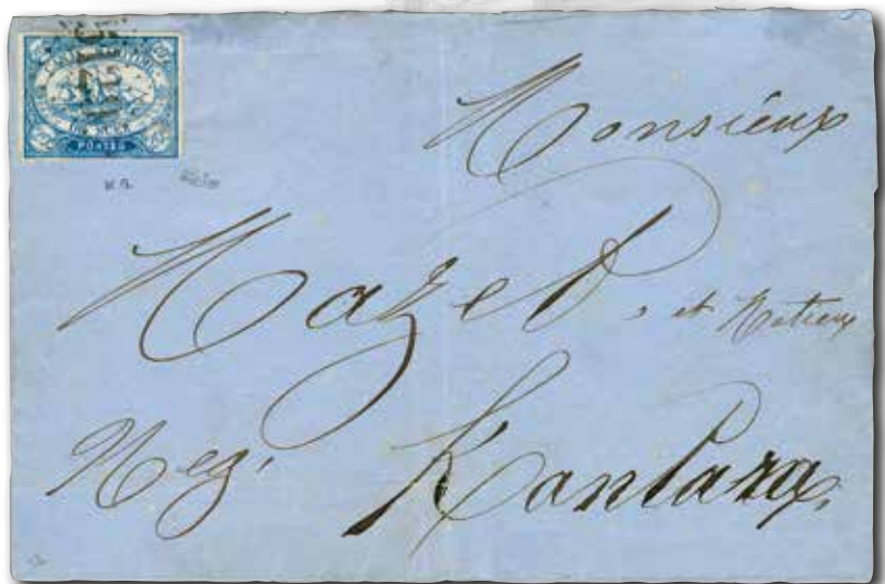
Lot 6373: Suez Canal Company 1868, 20 c. blue, used on cover to Kantara. CHF 12'200.- (incl. buyer's premium)