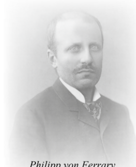
Philipp von Ferrary